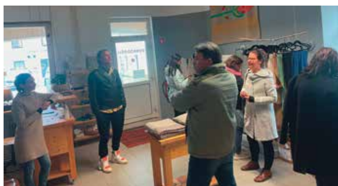
Udeleženci so med drugim obiskali Kreativnice