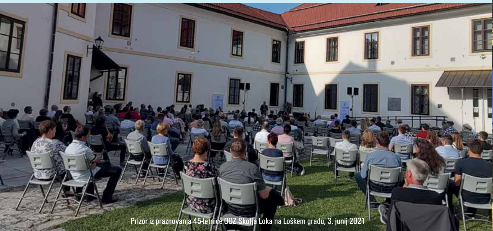
Prizor iz praznovanja 45-letnice OOO Škofja Loka na Loškem gradu, 3. junij 2021

Bolj podrobne informacije so na naši spletni strani www.ooz-skofjaloka.si .