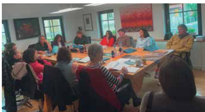
Udeleženci srečanja za rokodelce – Novosti in izzivi v rokodelstvu

Uspeh na razpisu je potrditev ključne vloge OOZ Škofja Loka pri izboljšanju podjetniškega okolja in spodbujanju podjetništva na lokalni ravni. Sodelovanje z drugimi institucijami omogoča izmenjavo znanja, izkušenj ter zagotavlja boljšo pokritost in dostopnost podpornih storitev za podjetnike na Gorenjskem in po vsej Sloveniji.