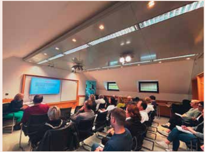
Prenos dejavnosti – notarska praksa