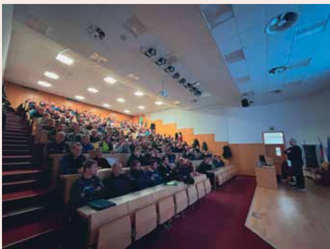
Usposabljanje voznikov – koda 95

Med strokovnimi dogodki je potekalo tudi regijsko srečanje slikopleskarjev, fasaderjev in črkoslikarjev namenjeno predstavitvi novosti na področju barv in premazov, trajnostnih rešitev ter aktualnih razmer v panogi. Udeleženci so se seznanili z novimi materiali, tehnološkimi pristopi in trendi, srečanje pa je omogočilo tudi izmenjavo izkušenj ter razpravo o izzivih, s katerimi se srečujejo pri svojem delu.