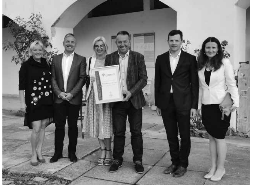
Ekipa podjetja Polycom d.o.o. – tradicija 35 let