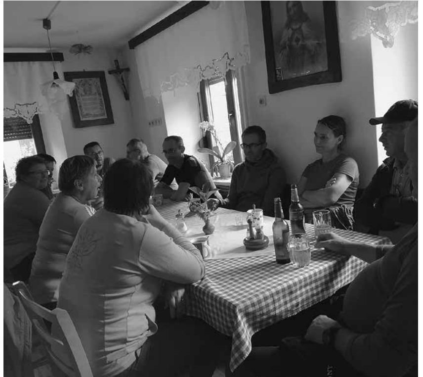
Obvezen postanek na kmetiji Andrejcion

V zelo sproščujočem vzdušju smo se člani sekcije, prisotne pa so bile tudi naše partnerice, seznanili tudi s tem, da bo že prestavljena pomladanska strokovna ekskurzija v Nemčijo morala počakati na izvedbo naslednje leto. Poskušali pa bomo pripraviti jesensko enodnevno ekskurzijo po Sloveniji. Proti koncu sestanka smo bili seznanjeni z nekaj aktualnimi temami, kot na primer z vsebino predloga petega