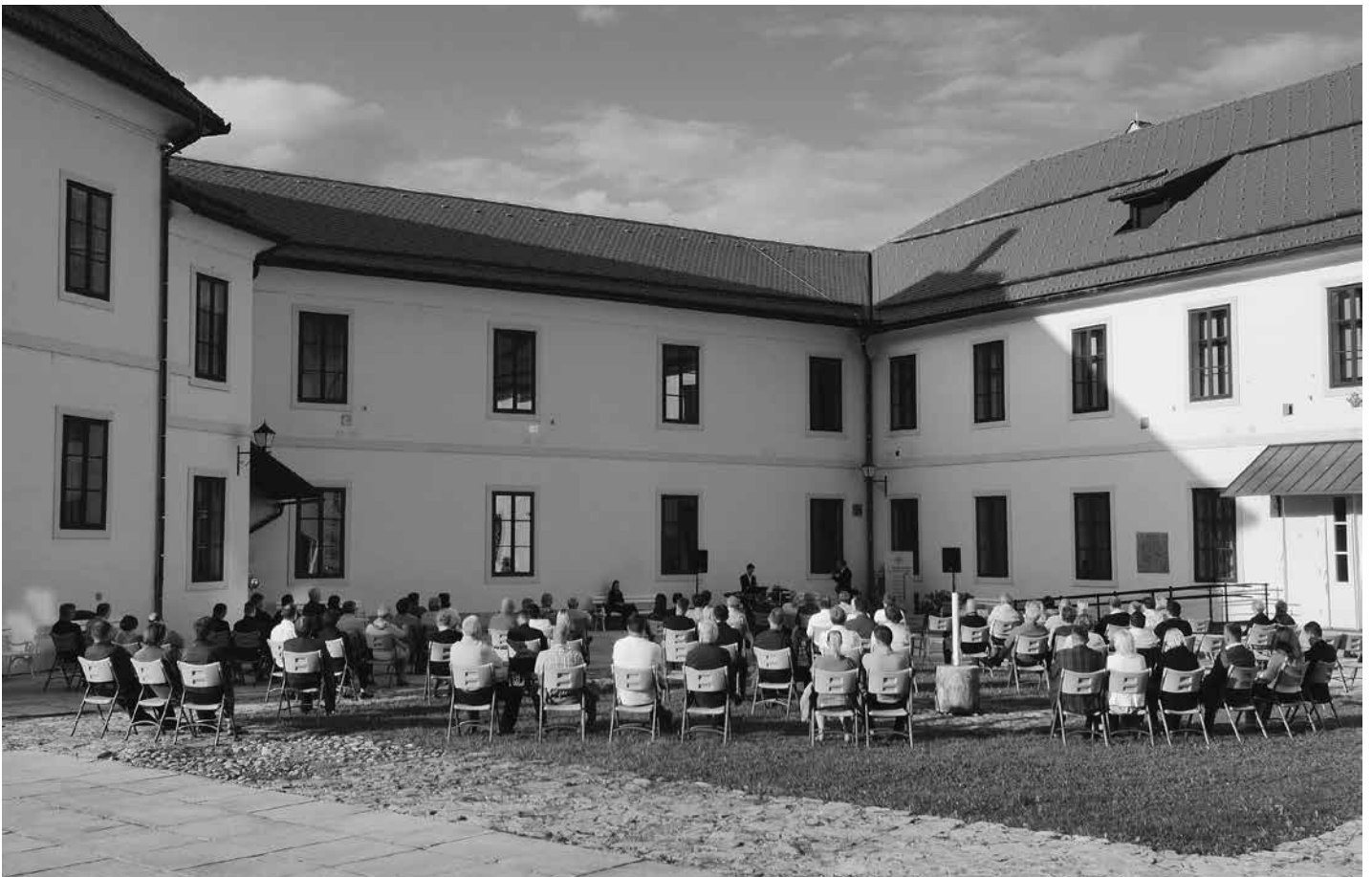
Prijeten ambient Loškega gradu