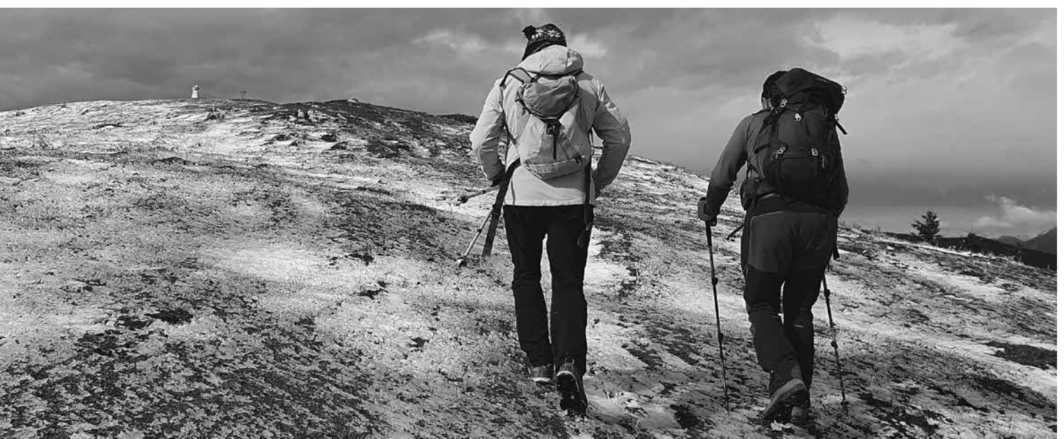
Proti pobeljenemu vrhu ...