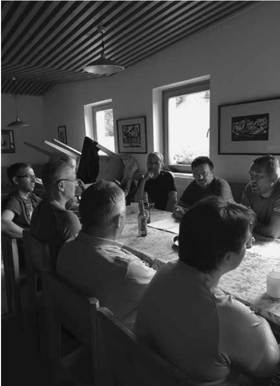
Sestanek v koči