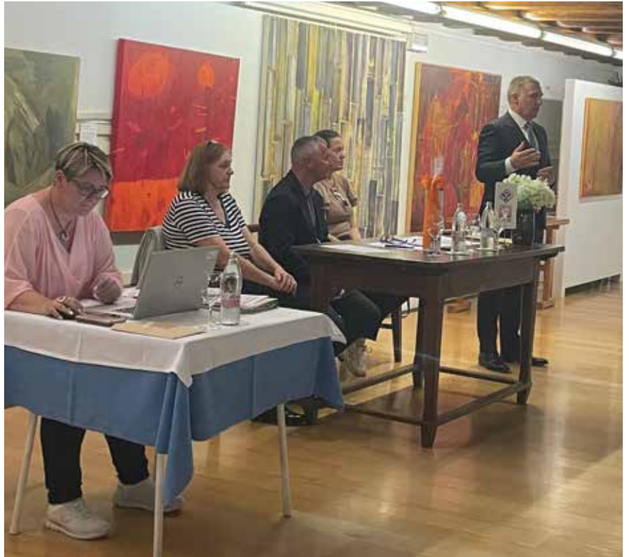
Nagovor novega predsednika

Že predhodno pa so svoje volitve izvedle strokovne sekcije. Pri nekaterih je prišlo tudi do reorganizacije. Sekciji gostincev so se po novem pridružili še člani, ki opravljajo živilsko dejavnost in sekcija se je preimenovala v Sekcijo gostincev in živilcev. Sekciji kovinarjev so se pridružili še člani, ki se ukvarjajo s predelavo plastičnih mas, livarji in