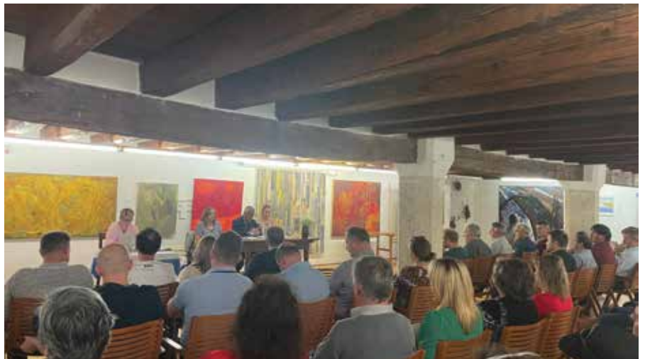
Sodelujoči na skupščini