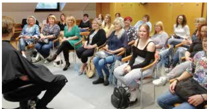
Udeleženke seminarja frizerske sekcije

Sekcija računovodij pa se je pridružila običaju sekcije frizerjev. V novem mandatnem obdobju je namreč pričela z rednimi mesečnimi sestanki na katerih se njeni člani seznanijo z aktualno zakonodajo, aktivnostmi na zbornici ter ob kavi izmenjujejo izkušnje in strokovno obravnavo v posameznih primerih.