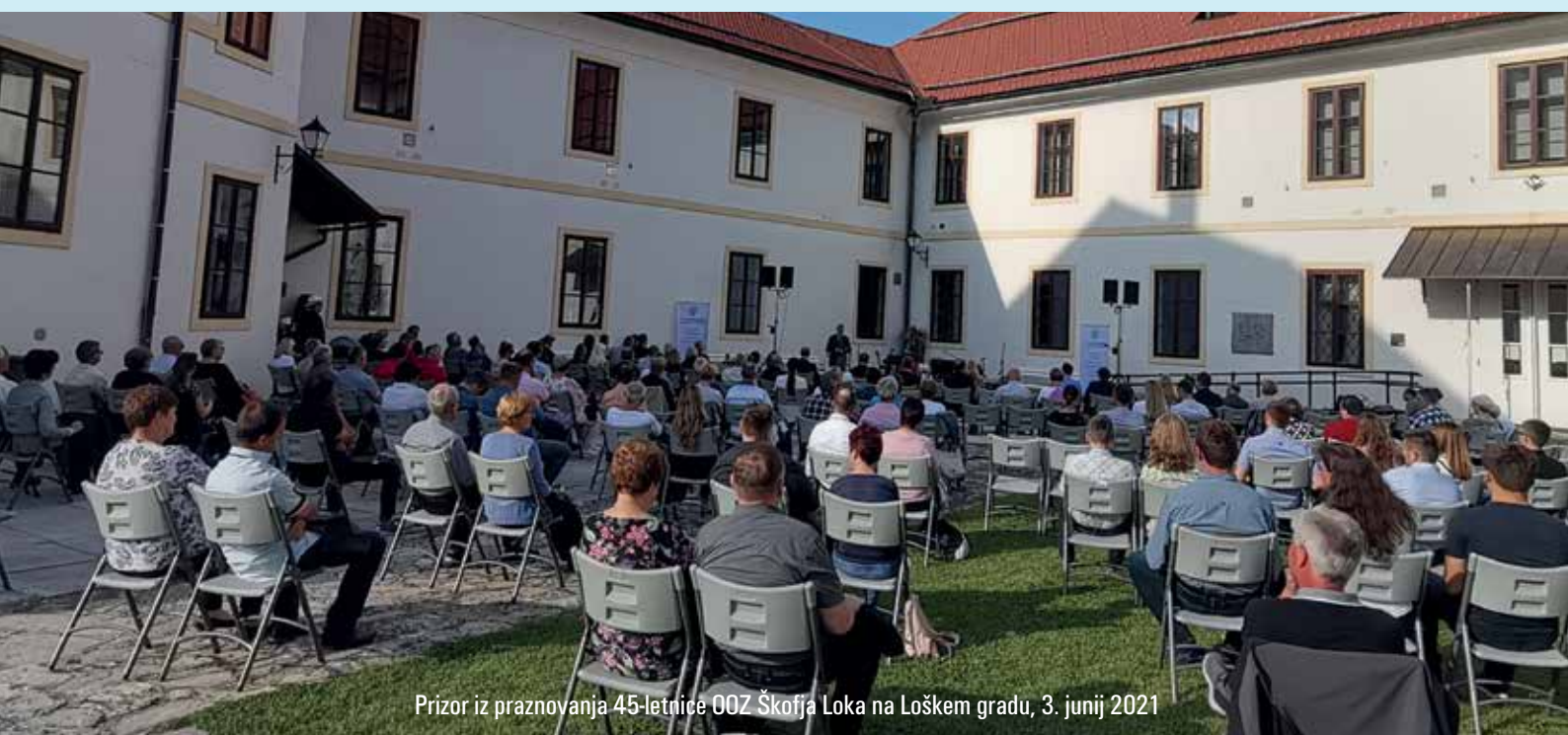
Prizor iz praznovanja 45-letnice OZ Škofja Loka na Loškem gradu, 3. junij 2021

Bolj podrobne informacije so na naši spletni strani www.oob-skofjaloka.si .