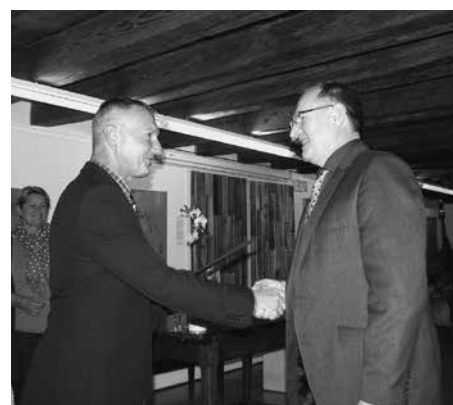
Za 85 let tradicije opravljanja dejavnosti je priznanje prejel Avtoservis Paulus.

Tudi letos je slovesnost s kratkim kulturnim programom potekala v Galeriji Franceta Miheliča v Kašči, in sicer v sredo, 26. oktobra, ko smo našim članom za 10, 20, 30, 35 in več let opravljanja dejavnosti izkazali pozornost in jim podelili priznanja. Prav tako smo posebno priznanje ob slovesnosti podelili tudi obratovalnicam, ki nadaljujejo z opravljanjem dejavnosti oziroma je ta v njihovi družini ali podjetju postala že tradicionalna. Letos je okrogli jubilej (10, 20, 30, 35 in 40 let) praznovalo 43 obrtnikov, 3 obratovalnice pa uspešno nadaljujejo tradicijo že 35 in več let.