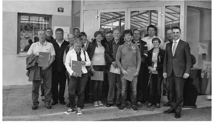
V podjetju LOTRIČ Meroslovje

Program je vseboval tudi sestanek v prostorih gostilne Pri Slavcu v Zalem logu, na katerem so se udeleženci dogovorili o programu naslednje strokovne ekskurzije ter sofinanciranih izobraževanj v prihodnje.