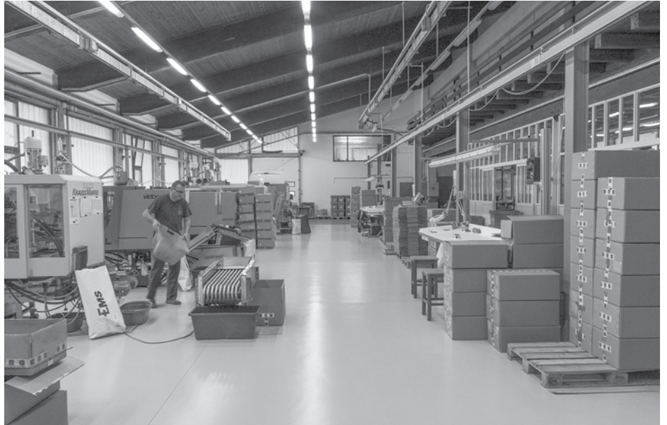
Prvi kooperant med malimi dobavitelji, ki je prejel Domelovo priznanje dobavitelj leta 1998.

Na več nivojih. Mi imamo lastno kontrolo, kupci imajo vhodno kontrolo, a ker so količine zelo velike, se seveda