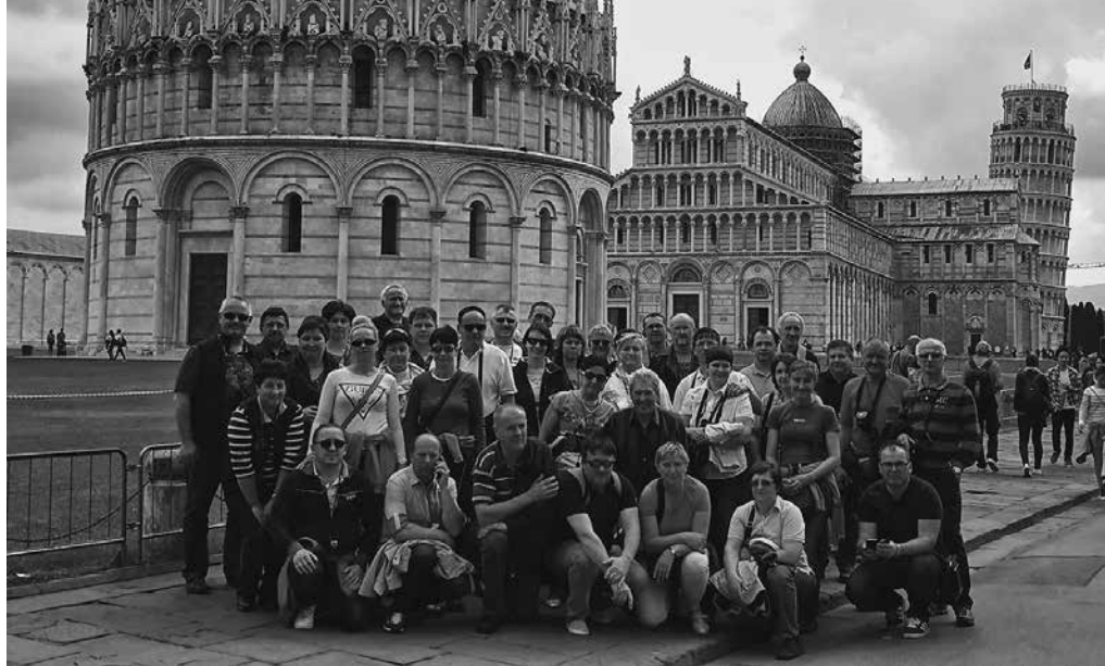
Mizarji v Pisi

Pot nas je naprej vodila do mesta Gubbio, kjer smo se sprehodili po slikovitih ulicah in si vmes privoščili tudi po-