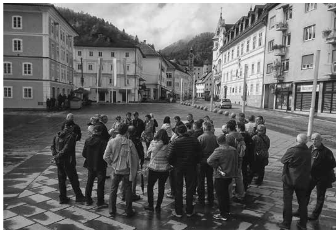
Mestni trg Idrija