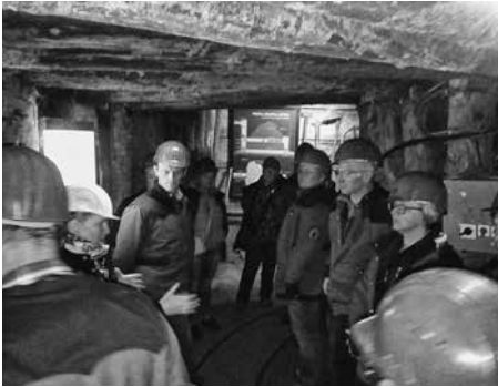
Mizarji v rovu

kev Sv. Trojice, pa vse do poslopja prve slovenske realke. Od tu pa se nam že ponuja pogled na grad Gewerkenegg, kjer je bila nekoč upravna stavba ru-