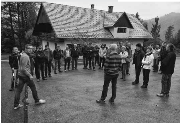
Sprejem pri podjetju LESKO

Pot nas je nato vodila v sam center Idrije in s pomočjo lokalnega vodnika smo si mesto temeljito ogledali. Na vsakem koraku se nam odstira dediščina živega srebra. Na Ahacijevem trgu se bohoti baročni vodnjak, ki je postavljen v spomin na leto 1508, ko so odkrili bogato najdišče cinabaritne rude. Trg obkrožajo še zgradbe, kot so nekdanje žitno skladišče in najstarejše zidano gledališče t. i. rudniško gledališče. Ko se sprehodimo do mestnega trga, se nam odpre lep pogled na mestno hišo in ljudsko šolo. V nadaljevanju sprehoda pridemo do najdišča živega srebra, kjer se danes nahaja cer-