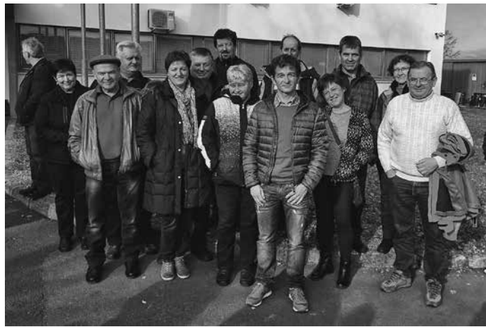
Pred podjetjem Mahle Lektrika v BIH

Udeležba članom Sekcije kovinarjev pri OZŠ Škofja Loka je bila dodatno sofinancirana s strani sekcije v višini 90 EUR na osebo, prevoz je plačala Sekcija kovinarjev pri OZŠ, ostale stroške pa so poravnali člani sami.