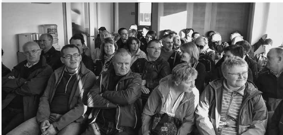
... pred pričetkom strokovnega predavanja ...

Naslednji dan sta nas jutranja kava in sončni žarki komaj prebudili, že smo se peljali v ne tako oddaljeno mesto Pisa. Seveda, ko človek omeni Piso, najprej pomisli na poševni stolp. Res je to najbolj znamenita stavba na trgu Piazza del Miracoli. Stolp so začeli graditi leta 1173, da je zrasel do skoraj 56 metrov višine pa sta morali miniti še skoraj dve stoletji. Od leta 2001 do letos pa je iz-