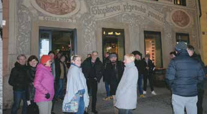
AVTOSERVISERJI NA ČEŠKEM