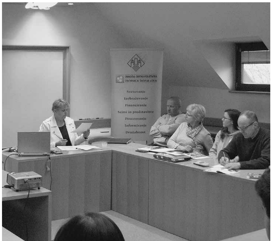
Udeleženci brezplačnega pedagoško-andragoškega seminarja

Ustrezna andragoška-pedagoška usposobljenost mentorjev je namreč pogoj za verifikacijo učnega mesta in s tem za izobraževanje vajencev. Zato smo na naši zbornici v sodelovanju z OZS organizirali brezplačno 3-dnevno usposabljanje, ki je potekalo 8., 9., in 15. aprila v veliki sejni sobi. Usposabljanje je obiskovalo 26 udeležencev iz panoge gradbeništva, lesarstva, elektro dejavnosti, frizerstva, kozmetike, gostinstva in avtoservisa. Seminarji v obsegu 24 ur so se za bodoče mentorje zaključili s samostojno pripravo projektne naloge ob svetovanju predavatelja, za bodoče mojstre pa so bili dobra predpriprava za opravljanje enega od pomembnih delov mojstrskega izpita. Vsem udeležencem so bile s strani predavateljev posredovane potrebne informacije, znanja in napotki za uspešen prenos znanj in veščin na mlade.