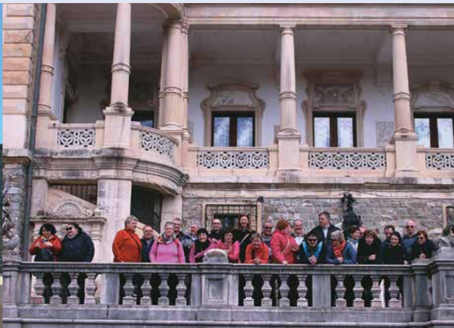
LESARJI V ROMUNIJ