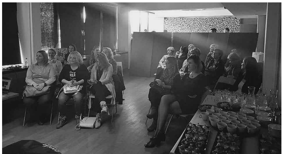
Udeleženke dogodka Londa

Tudi sicer je sekcija frizerjev s svojo predsednico ena od bolj aktivnih sekcij, ki se s svojimi članicami srečuje na rednih mesečnih sestankih , kjer v sproščujočem vzdušju predebatirajo aktualne vsebine na zakonodajnem ter strokovnem področju in se sproti dogovarjajo o novih aktivnostih, ki bodo prebudile njihovo ustvarjalnost, s katero bodo vplivale na zadovoljstvo strank, ki jim zaupajo nego svojih las in oblikovanje pričesk.