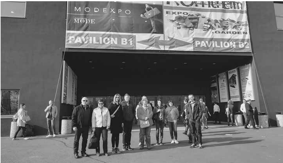
Pred vhodom na pohištveni sejem Mobiliaexpo.

70 arhitektov in zgradba velja za najtežjo na svetu, saj naj bi tehtala kar 4.100.000.000 kilogramov. Žal vanjo nismo mogli vstopiti, ker trenutno Romunija predseduje Svetu Evrope in v palači potekajo plenarna zasedanja. Ogledali pa smo si notranjost zgradbe, kjer je prebivala družina Causescu in so jo letos odprli za javnost. Zares razkošna notranjost razkriva vse bogastvo takratnega komunističnega voditelja, seveda pa ne gre tu prezreti tudi vloge gospe in njegovih treh otrok, ki so bolj ali manj vsi končali tragično. Po ogledu palače, ki na zunaj ne daje vtisa razkošja, smo se odpeljali na prostor sejmišča, kjer smo si ogledali že prej omenjeni sejem pohištva. Zvečer smo se zopet kar peš podali v stari otomanski del Bukarešte in v tamkajšnji najstarejši turški restavraciji okusili tradicionalne dobrote ter uživali v kulturno umetniškem programu.