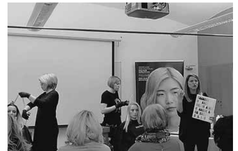
Izobraževanje na OOO Kamnik.

Želja sekcije je bila tudi, da bi organizirala dvodnevni ogled sejma Beauty & Hair Expo v Zagrebu , vendar skupno število prijavljenih ni bilo za-