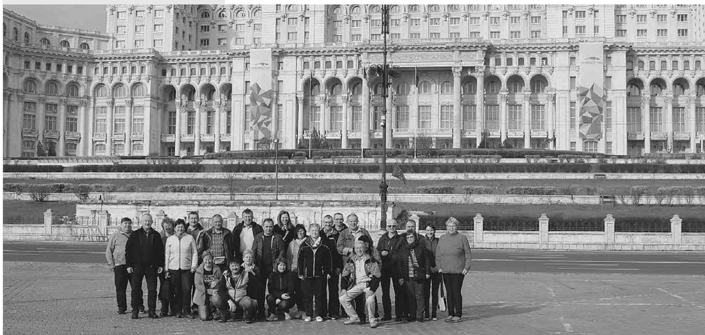
Skupinska slika udeležencev strokovne ekskurzije lesarjev pred parlamentom v Bukarešti.

Drugi dan smo celo dopoldne namenili ogledu mesta. Najprej smo se po glavni aveniji, mimo številnih fontan, pripeljali do palače parlamenta , ki sta jo dala zgraditi romunski diktator Nikolai Causescu in njegova soproga Elena . Kar pet let jo je gradilo 20.000 delavcev, načrtovalo jo je kar