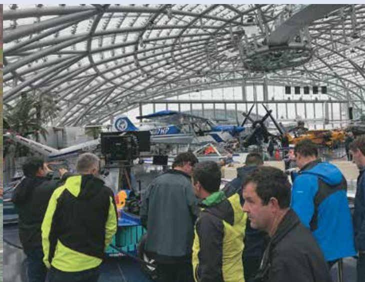
GRADBENIKI V AVSTRIJI IN NEMČIJI