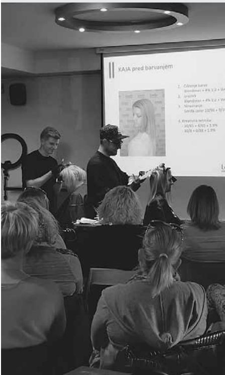
Prikaz novih tehnik barvanja las.

Frizerska sekcija spodbuja svoje članice, da naj bodo vsak dan boljše, bolj ustvarjane in da naj bo to njihova konkurenčna prednost.